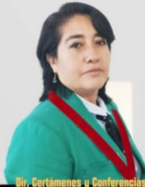
Dir. Certámenes y Conferencias CPC Gemma G. Alcalde Vega